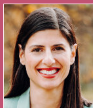
Derya Çağlar, MdB Stellv. Fraktionsvorsitzende