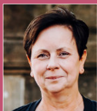
Mirjam Golm, MdB Gleichstellungspolitische Sprecherin