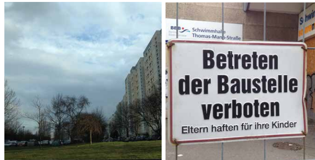
Mögliches Baufeld an der Michelangelostr. Schwimmhallensanierung startet!

Anschließend daran werde ich gemeinsam mit der Pankower Schulstadträtin Lioba Zürn-Kasztantowicz den Campus des ehemaligen Coubertin-Gymnasiums besuchen. Hier wird ein neues Gymnasium entstehen, um dem steigenden Bedarf an Oberschulplätzen in unserem Bezirk gerecht zu werden. Die weiteren Schritte zum Aufbau dieses Schulstandortes und auch die zukünftige Entwicklung der umliegenden Schulen im Böttzowviertel stehen im Mittelpunkt des Informationsgesprächs mit der Stadträtin. Sie sind als Eltern, Nachbarinnen und Nachbarn herzlich eingeladen, sich an der Diskussion mit der Bezirksstadträtin zu beteiligen.