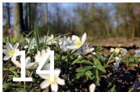
Umwelt und Klimaschutz