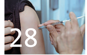
Gesundheit – Pflege – Gleichstellung