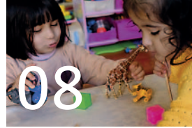
Jugend und Familie