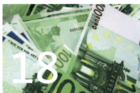
Haushalt und Investitionen