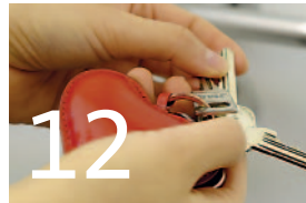
Bauen – Wohnen – Mieten