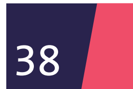
Die Abgeordneten der SPD-Fraktion