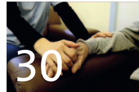
Soziales und Integration