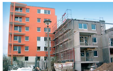
Während des Rück- und Umbaus der Ahrensfelder Terrassen

Deutschlandweit ein Vorzeigeprojekt sind die „Ahrensfelder Terrassen“, wo 1.670 Wohnungen, die sich zuvor in dominierenden kompakten, unsanierten elfgeschossigen Gebäuden mit hohem Leerstand befanden, zu Stadtvillen mit 447 Wohnungen umgebaut wurden, die heute voll vermietet sind. Im Frühjahr 2009 beendet Berlins größtes